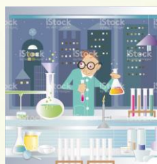
Microsoft Collection Clipart Word 2010

Concept : Créer un jeu d'évasion où chaque énigme résolue (un exercice de mathématiques) donne une pièce d'un puzzle.